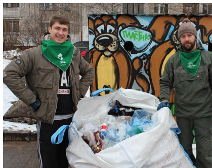
На фото – активисты движения ЭКА в Иркутске.