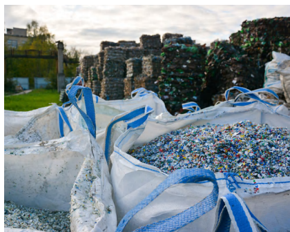
Фото с перерабатывающего завода ГК «Экотехнологии»