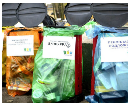
Одна из акций движения «Раздельный Сбор»