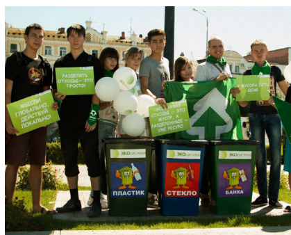
Акция по сбору вторсырья Астраханского отделения движения ЭКА