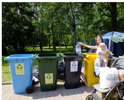
Праздник «Экодвор» в Москве, организованном активистами движений ЭКА и «Раздельный Сбор»