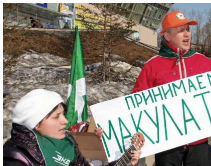
На фото – активисты движения ЭКА в Ярославле.

В то же время, даже если во дворах появятся контейнеры для вторсырья, но жители не будут знать о пользе разделного сбора отходов, система не заработает, поэтому так важна просветительская работа и такие инициативы, как «Экодвор».