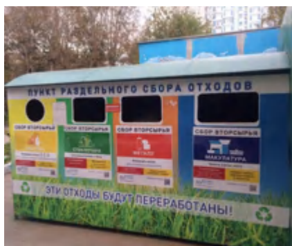
Во дворе установлены постоянные контейнеры для сбора вторсырья