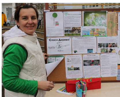
Мини-выставка на одном из праздников «Экодвор» в Москве, организованном активистами движений ЭКА и «Раздельный Сбор»