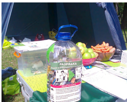
Сбор батареек для передачи в безопасную утилизацию на одном из праздников «Экодвор» в Москве, организованном активистами движений ЭКА и «Раздельный Сбор»

Например, можно собирать батарейки. Организовать сам сбор на мероприятии несложно — для этого нужно просто поставить отдельную пятилитровую бутылку с плотно закручивающейся крышкой. Но прежде чем это сделать