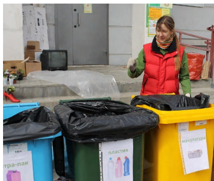
Активисты организуют акцию по сбору вторсырья в рамках праздника «Экодвор»

Долгосрочная цель — наладить отдельный сбор отходов на постоянной основе, в частности, чтобы были установлены