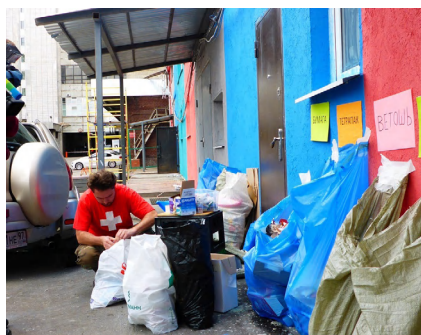
Акция по сбору вторсырья в доме культуры «Делай сам/а» в Москве

Лучше понимать, как именно вам организовать сбор отходов во время проведения акции, вы сможете после того, как пообщаетесь с компанией, которая у вас будет забирать вторсырье.