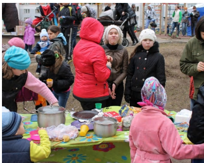
Фото соседского обеда на одном из праздников «Экодвор» в Москве, организованном активистами движений ЭКА и «Раздельный сбор»

Ролик Первого канала о традиционном ежегодном соседском обеде в Ярославле