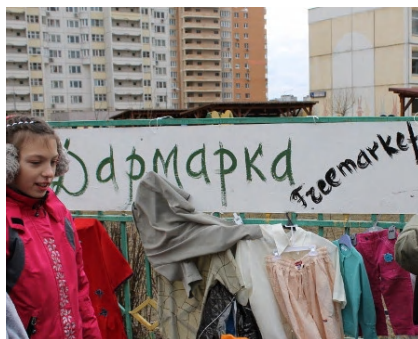
Фото «Дармарки» на одном из праздников «Экодвор» в Москве, организованном активистами движений ЭКА и «Раздельный Сбор»