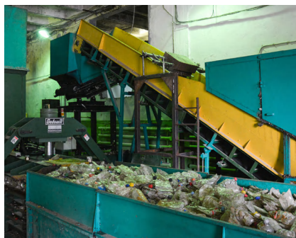
Фото с перерабатывающего завода ГК «Экотехнологии»