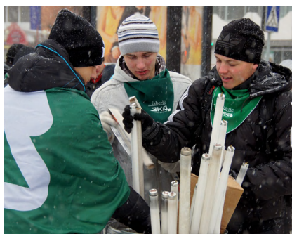
Сбор ртутных ламп в ходе акции активистов движения ЭКА в Тамбове