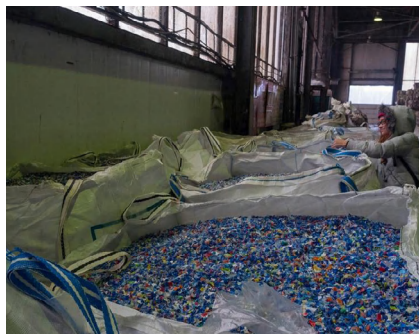
Фото с завода «Пларус» по переработке пластиковых бутылок (г. Солнечногорск) ( прочитать репортаж с экскурсии на завод )