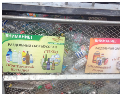
Пункт приема вторсырья в Мытищах: пример оформления контейнеров и обращения к жителям от имени компании