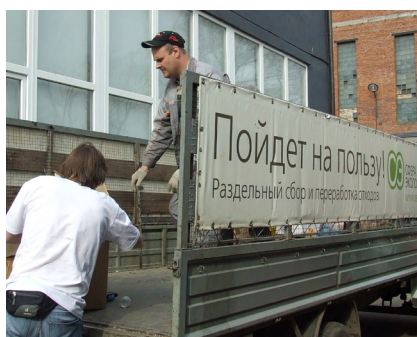
Вывоз вторсырья с акции проекта «Разделяй и здравствуй!» в рамках фестиваля городских инициатив «Делай сам»