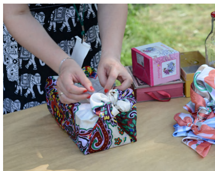
Мастер-класс по фурушки на одном из экофестивалей движения ЭКА