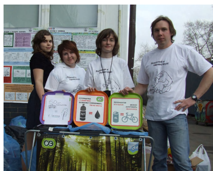
Фото с акции проекта «Разделяй и здравствуй!» по сбору вторсырья в рамках фестиваля городских инициатив «Делай сам»

Для этого вы можете воспользоваться логотипом проекта в кривых, скачав его по ссылке