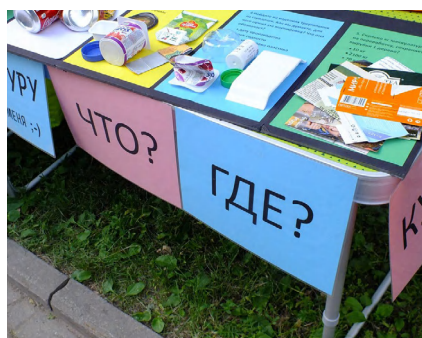
Информационный стенд на одном из праздников «Экодвор» в Москве, организованном активистами движений ЭКА и «Раздельный Сбор»