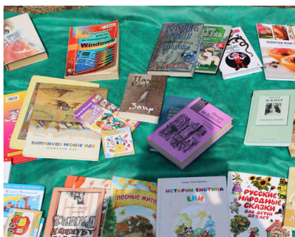
Фото книговорота на одном из праздников «Экодвор» в Москве, организованном активистами движений ЭКА и «Раздельный Сбор»

Тематические Дармарки удобно делать, если у вас немного места и нет отдельного волонтера, кто мог бы обеспечивать порядок среди вещей. В некоторых дворах или других городских площадках есть стационарные места для книговорота — это могут быть полки в подъезде или каком-то посещаемом месте — шкаф в парке или местной библиотеке, клубе и т.д., где люди обмениваются книгами.