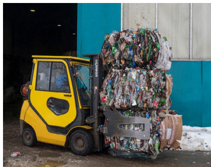
Фото с завода «Пларус» по переработке пластиковых бутылок (г. Солнечногорск) ( прочитать репортаж с экскурсии на завод )